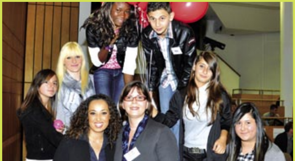
HP Pelzer fördert sechs Patenkindern

Somit konnten dreizehn Achtklässler in diesem Schuljahr im Projekt aufgenommen werden, vier Mädchen und sieben Jungen. Aktuell werden 52 Kinder durch 33 Unternehmen und Organisationen im Projekt gefördert.