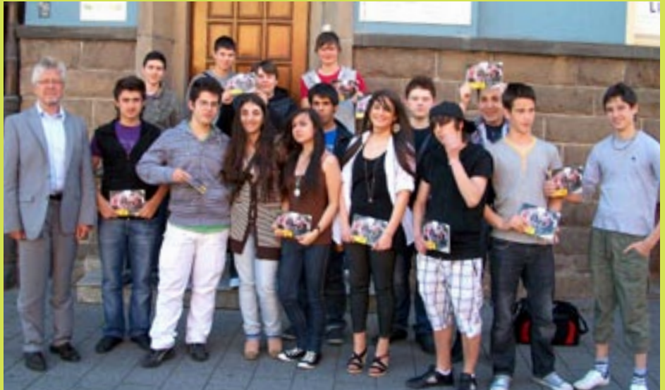
Ein Bogestramitarbeiter stellt den Kinder unterschiedliche Berufe vor.

Kinder die sozialpädagogische Begleitung gesichert ist. Die Solidarfonds-Stiftung NRW hat uns die Finanzierung zugesagt. Vielen Dank!